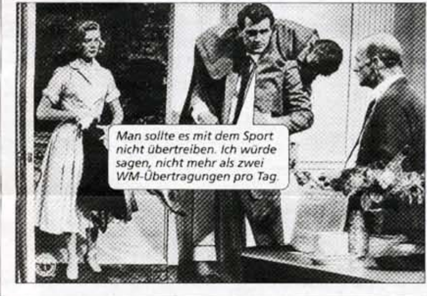
Man sollte es mit dem Sport nicht übertreiben. Ich würde sagen, nicht mehr als zwei WM-Übertragungen pro Tag